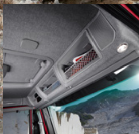
CONSOLA SUPERIOR CON PORTAOBJETOS