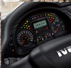
NUEVO PANEL DE INSTRUMENTOS